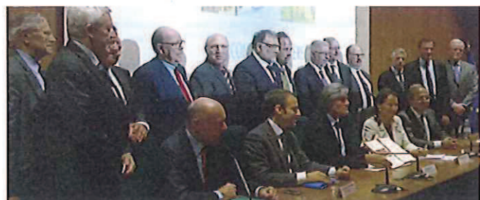
Signature du Contrat de filière en présence de 3 des 4 ministres impliqués et des représentants des acteurs engagés, le 16 décembre 2014.